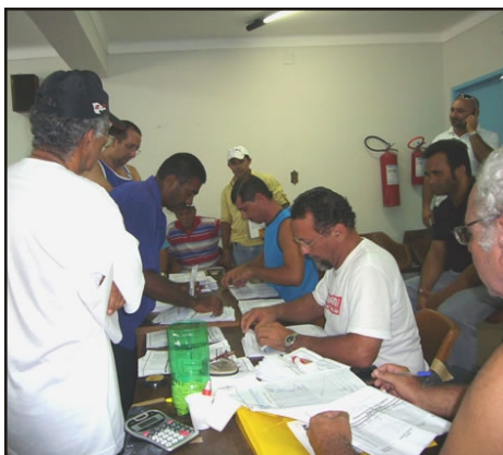
Chapa 3 vence com 67% dos votos