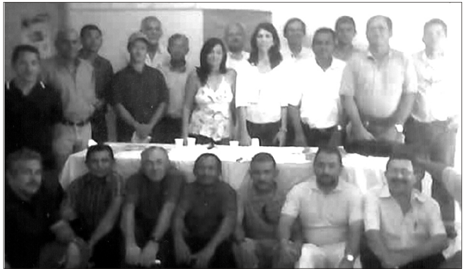
Diretoria Plena do Sindágua/RN

A Diretoria Plena do Sindágua/RN se reuniu no dia 4 de dezembro de 2006 para realizar o balanço do ano que se findava e planejar este que se inicia. A reunião teve a participação de todos os diretores do sindicato, que debateram exaustivamente os pontos da pauta.